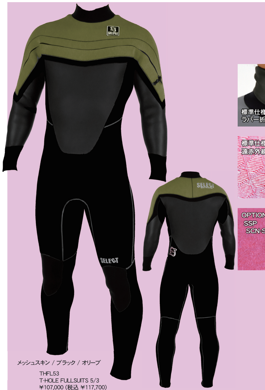
メッシュスキン / ブラック / オリーブ THFL53 T-HOLE FULLSUITS 5/3 ¥107,000 (税込 ¥117,700)