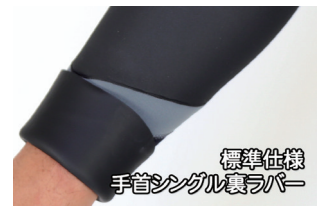
標準仕様 手首シングル裏ラバー