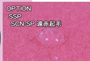
OPTION SSP SCN-SP 遠赤起毛