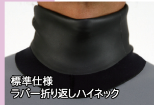
標準仕様 ラバー折り返しハイネック