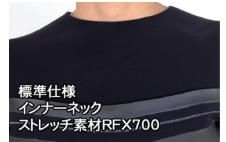
標準仕様 インナーネック ストレッチ素材RFX700